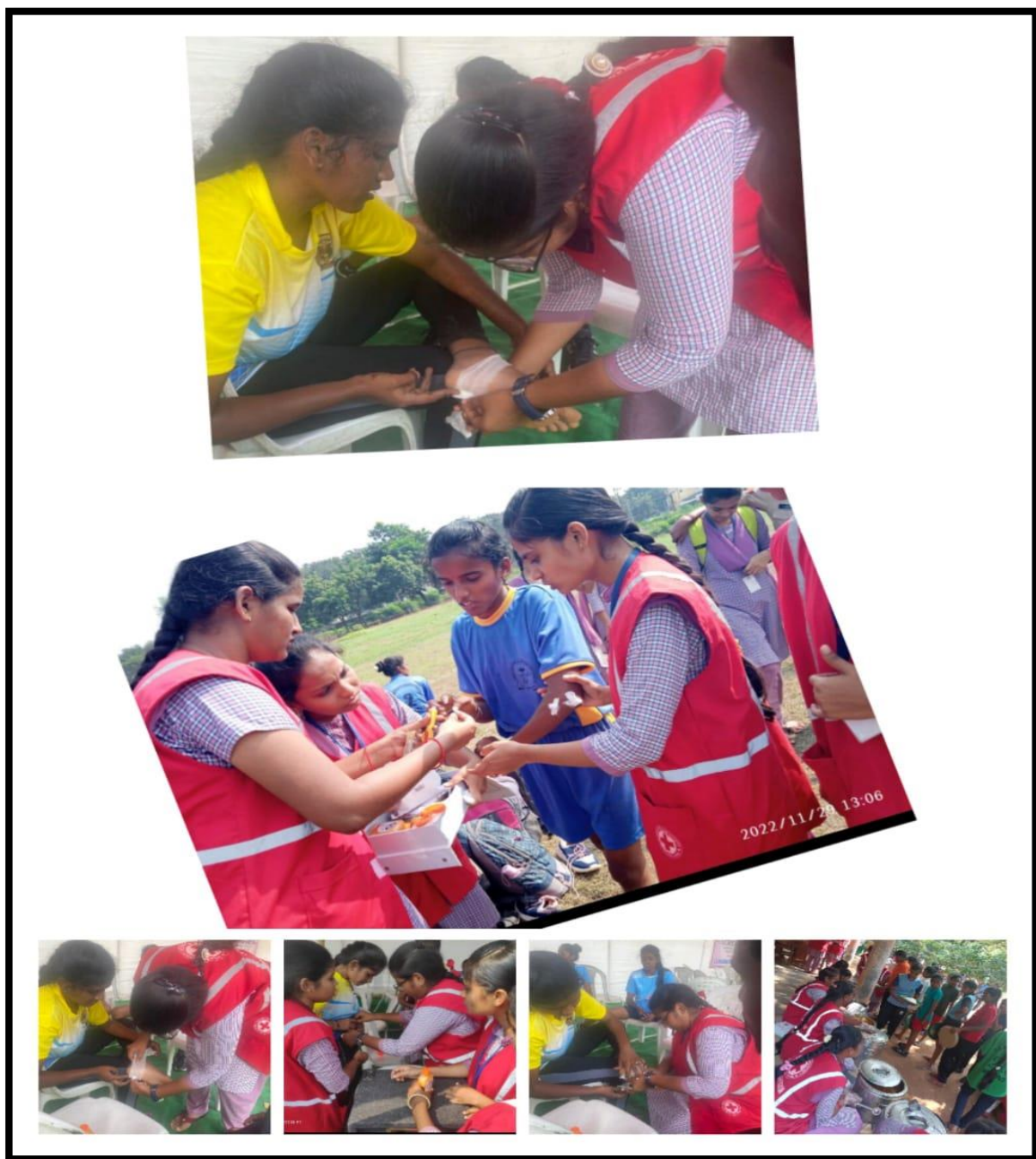
YRC Volunteers providing medical aid to Sports girls during games tournament