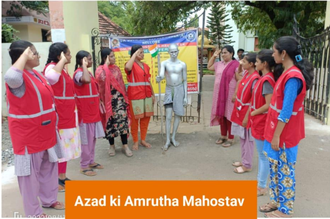
Azad ki Amrutha Mahostav